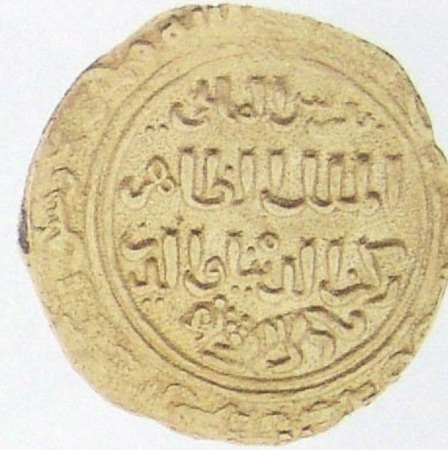
دينار مملوكي الظاهر بيبرس ضرب: الإسكندرية سنة: ٦٥٩ هجري